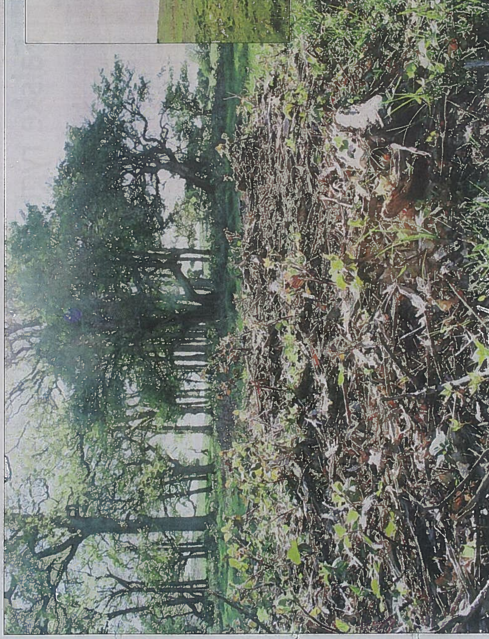
Brombær er begyndt at spire frem fra kvasset, der ligger på jorden efter rydningen.

Nu skal man dog i gang med at følge op på rydningen med en handleplan for plejen af naturområdet, så man også i fremtiden kan sikre området mod omfattende genvækst.