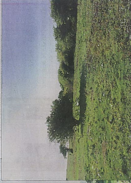
I landskabet kan man se kvasset efter rydningen.